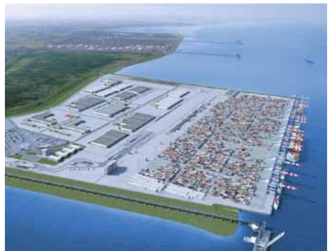
Die künftigen JadeWeserPorts gelten als größtes norddeutsches Infrastrukturprojekt der letzten 50 Jahre.

Die beschlossene Energiewende und der Boom der Offshore-Windenergie bei gleichzeitiger Knappheit geeigneter Hafenstrukturen und -anlagen eröffnet Wilhelmshaven weitere große Möglichkeiten. Durch die Nähe zu den Offshore-Windparks, insbesondere in der Nordsee, und die günstigen nautischen Bedingungen ist Wilhelmshaven der ideale Standort für die Offshore-Windenergieerzeugung. Wilhelmshaven erfüllt alle Voraussetzungen als Service-, Schutz-, Installations- und Pro-