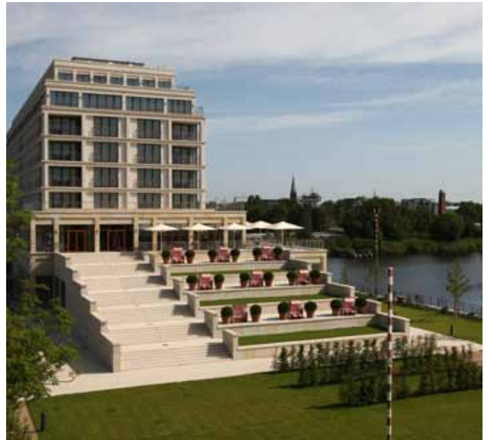
Das Vier-Sterne-Superior-Hotel COLUMBIA bietet exzellente Übernachtungsmöglichkeiten und mehr.

duktionshafen. Ansässige Unternehmen mit langjähriger Erfahrung im Offshore-Geschäft, das international renommierte Deutsche Windenergie Institut DEWI und nicht zuletzt auch die Nähe zum JadeWeserAirport Mariensiel/Wilhelmshaven mit Helicopter Service bieten Ansiedlern einen deutlichen Mehrwert.