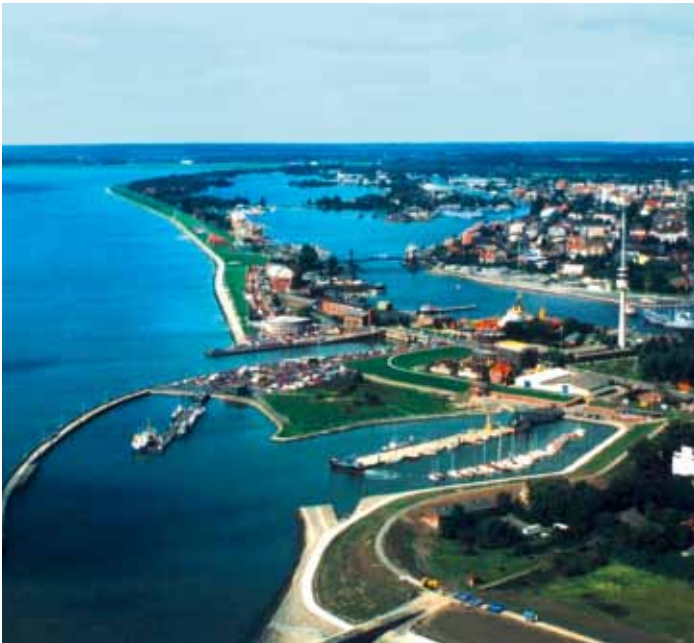
Wilhelmshaven aus der Luft